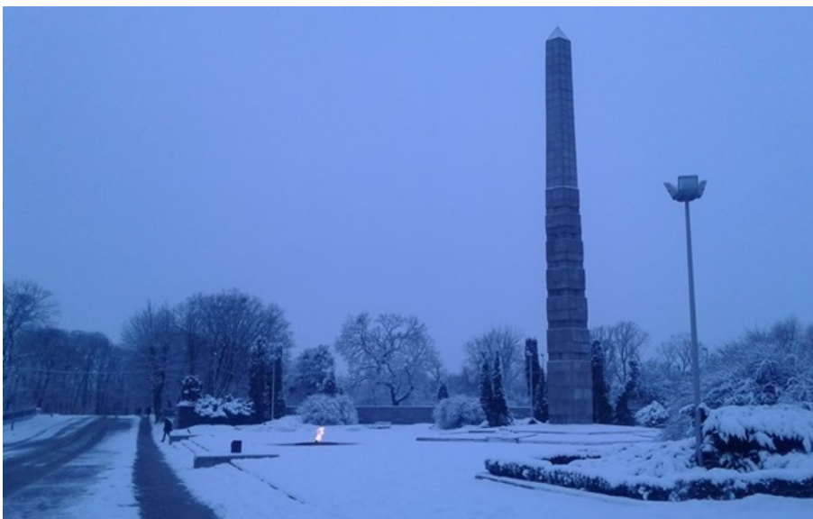
Фото: Російські ЗМІ (ілюстративне фото)

ЗМІ зазначають, що чоловік написав на снігу "Ні війні" і підпалив себе близько п'ятої ранку, а тіло виявив перехожий о 6:40