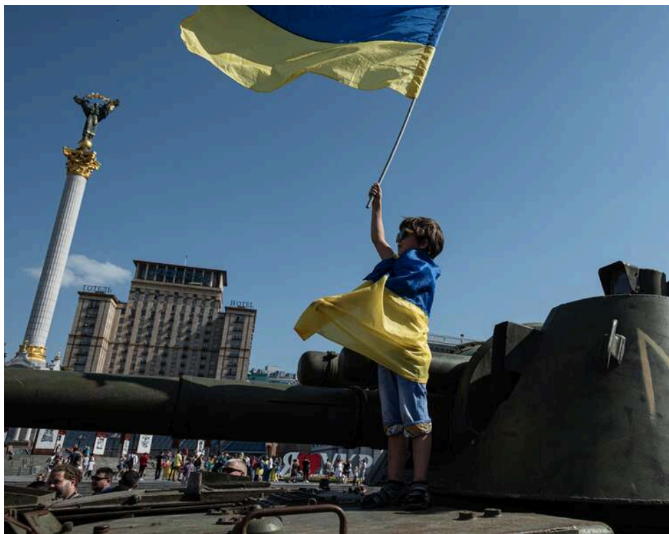
Реформи та податки заради допомоги: 48% українців готові до непопулярних кроків задля західного фінансування

48% українців переконані, що влада повинна прийняти всі необхідні заходи для залучення західної фінансової допомоги, навіть за умови непопулярних кроків та зростання податків.