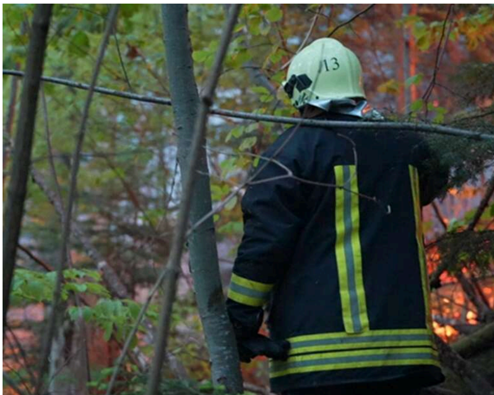
Друга доба боротьби зі стихією: На Закарпатті масштабна лісова пожежа, до гасіння залучено авіацію

На Закарпатті вже понад добу палає масштабна лісова пожежа. Рятувальникам на підмогу прибули колеги з двох сусідніх областей, а прокуратура розслідує причини займання в межах кримінальної справи.