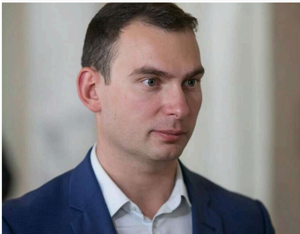
Санкції в обмін на голоси за бюджет: Нардеп заявив про обіцянку Зеленського не використовувати РНБО проти українців

Народний депутат Железняк, посилаючись на джерела, повідомив, що Зеленський пообіцяв депутатам припинити використання санкцій проти громадян України в політичних цілях.