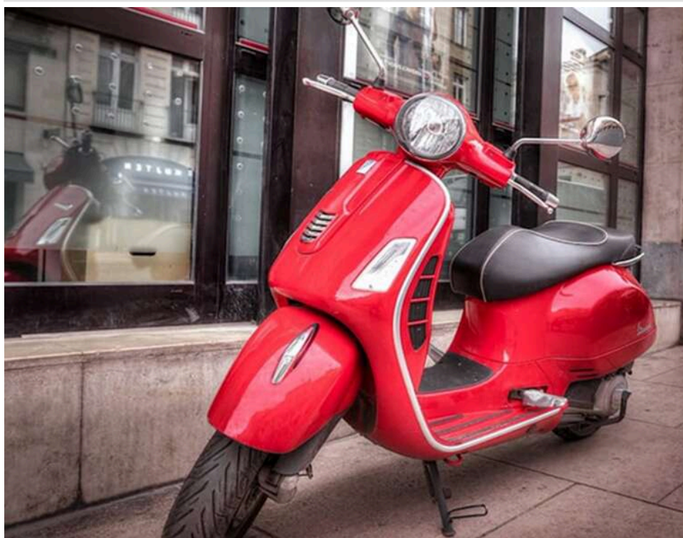
За кермо у 15 років: Кабмін пропонує дозволити підліткам керувати мопедами, а з 17 – автівками

Уряд пропонує зменшити мінімальний вік для керування мопедами (швидкість до 45 км/год) з 16 до 15 років.