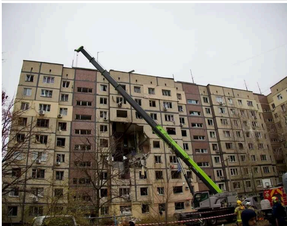
Трудова повинність у Дніпрі: міськрада планує залучати мешканців до розбору завалів після атак

У Дніпрі людей можуть змушувати розбирати завали після обстрілів, – повідомляє Телеграф з посиланням на міську раду.