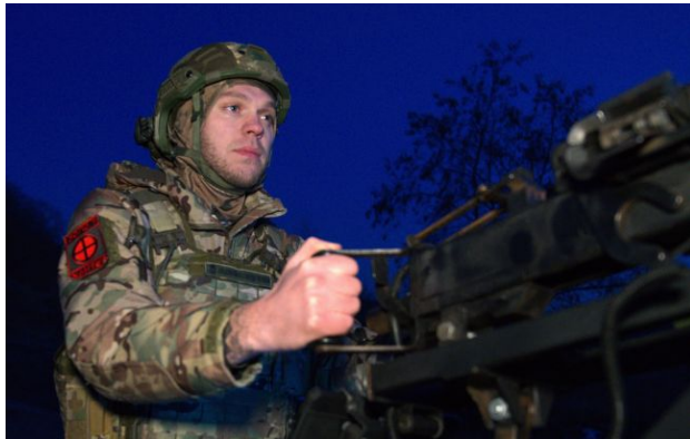
Фото: поки незрозуміло, чи були зафіксовані дрони запущені ще до того, як настав режим "тиші"

Обирайте перевірене - додайте РБК-Україна до улюблених джерел у Google