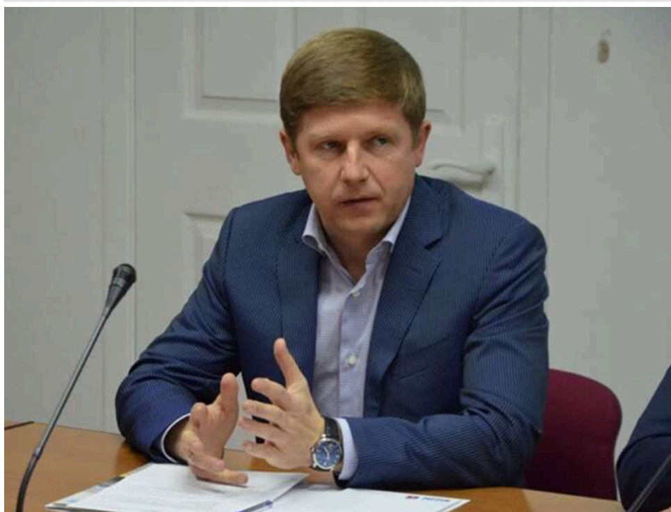
Депутат Нагорняк пропонує легалізувати економічне бронювання для підтримки ЗСУ

Народний депутат від партії «Слуга народу» Сергій Нагорняк виступив з пропозицією ввести систему економічного бронювання – офіційну відстрочку від мобілізації за певну плату. Отримані кошти планується використовувати для фінансового стимулювання добровольців.