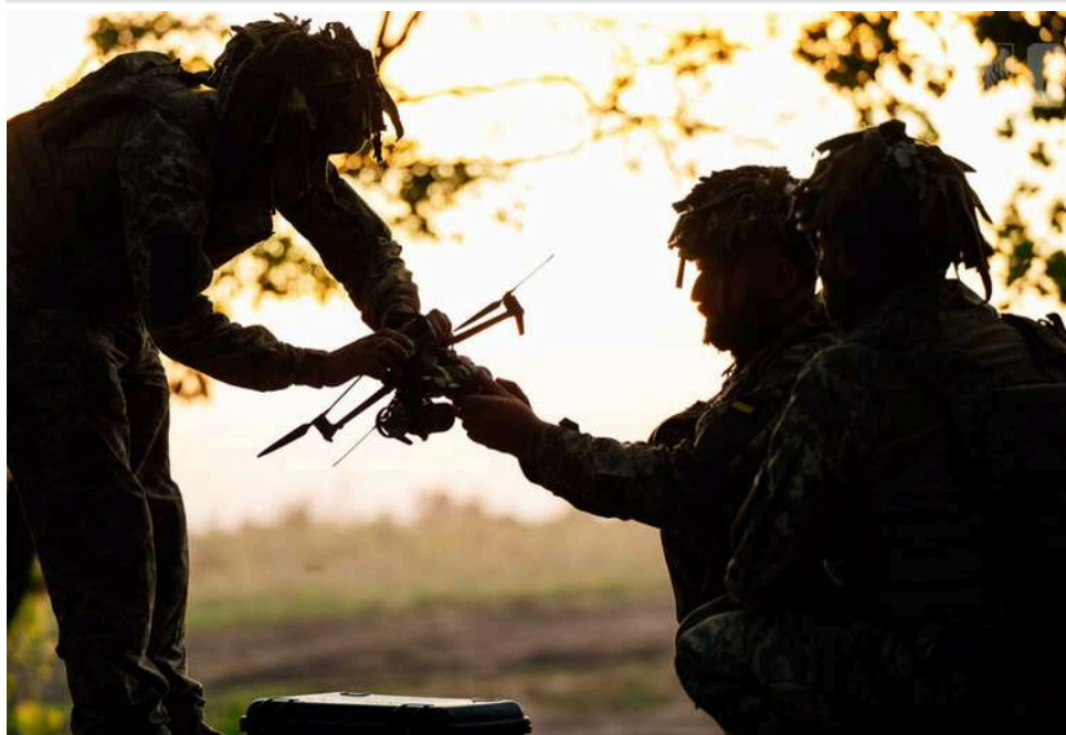
Ситуація на фронті: понад 100 боєзіткнень за добу, ворог посилив тиск по всій лінії фронту

Від початку доби 13 квітня на фронті сталося 104 бойові зіткнення.