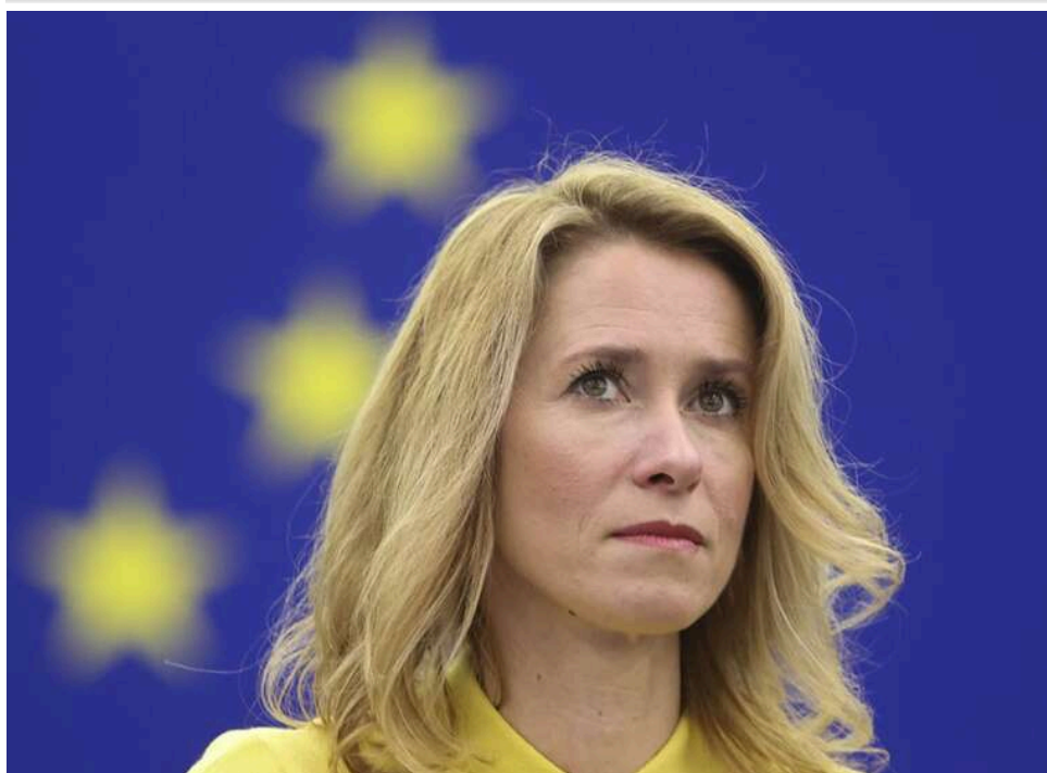
Каллас в ООН: Росія здійснює найтяжчий злочин проти міжнародного права за останні десятиліття

Глава дипломатії ЄС Кая Каллас заявила, що агресія Росії проти України є грубим порушенням міжнародного права.