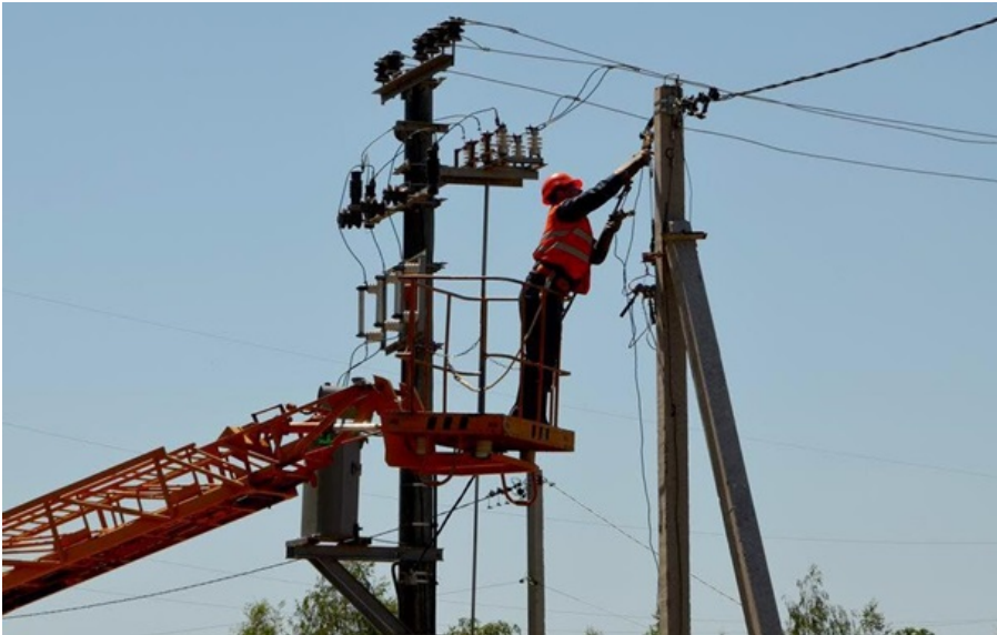
Завтра українці будуть зі світлом за умови відсутності нових атак рашистів

Споживачів просять бути ощадливими і перенести енергоємні процеси на денний час – із 10:00 до 16:00.