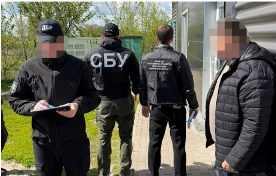
Фігуранту повідомили про підозру

Під час огляду місця події правоохоронці вилучили гроші, а також мобільний телефон фігуранта.