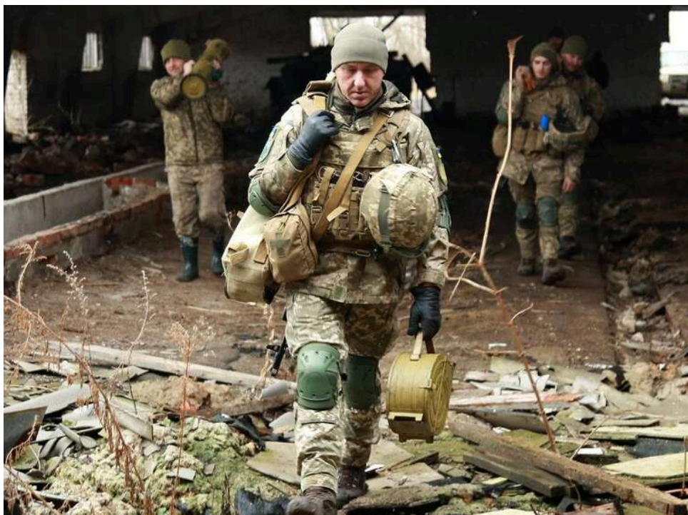
Ситуація на фронті: Війська РФ здійснили 65 атак від початку доби, найважчі бої на Покровському напрямку

Від початку доби 5 травня 2026 року на фронті зафіксовано вже 65 атак ворога на позиції Сил оборони.