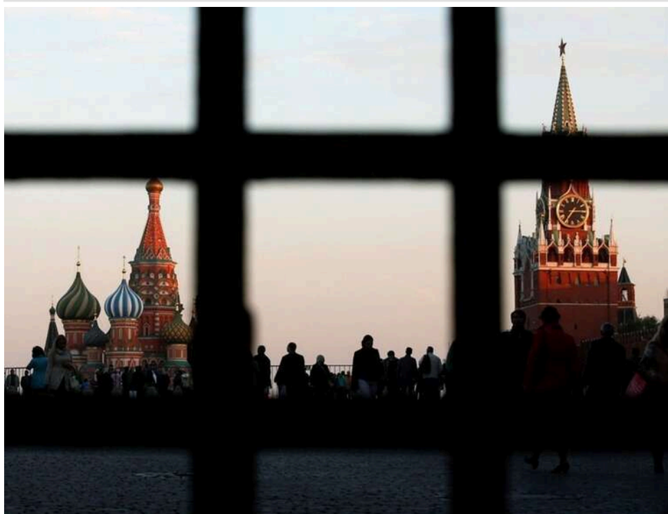
"Писок у панцирі, а д*па гола": Мадяр висміяв ППО Кремля після нічних ударів по нафтових об'єктах РФ

"Коли велич територій «необ'ятної» перетворюється на стратегічну вразливість. Безкрайї прохідний двір намалювався: прикриваючи писок руками від удару, пам'ятай, сохатий диктаторе, - твої яйця залишатимуться беззахисними, як сьогодні вночі- від Балтики (нафтові Кіріші дроздовські, версія 5.0) аж до Чебоксарщини у Чувашії", - про це написав командувач Сил безпілотних систем Роберт "Мадяр" Бровді.