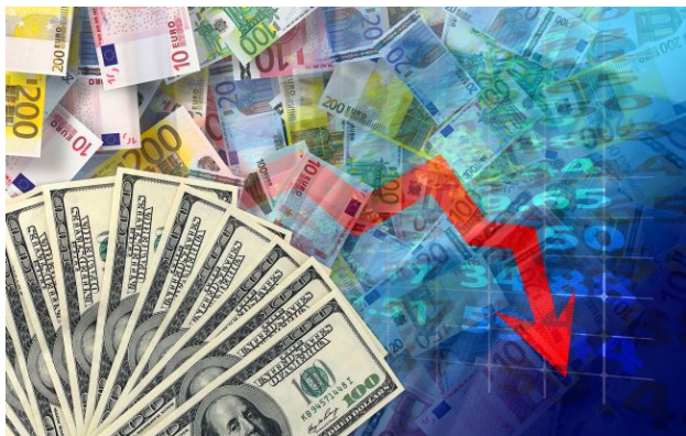
Фото: НБУ оновив офіційний курс валют на 6 травня (Getty Images)

Обирайте перевірене - додайте РБК-Україна до улюблених джерел у Google