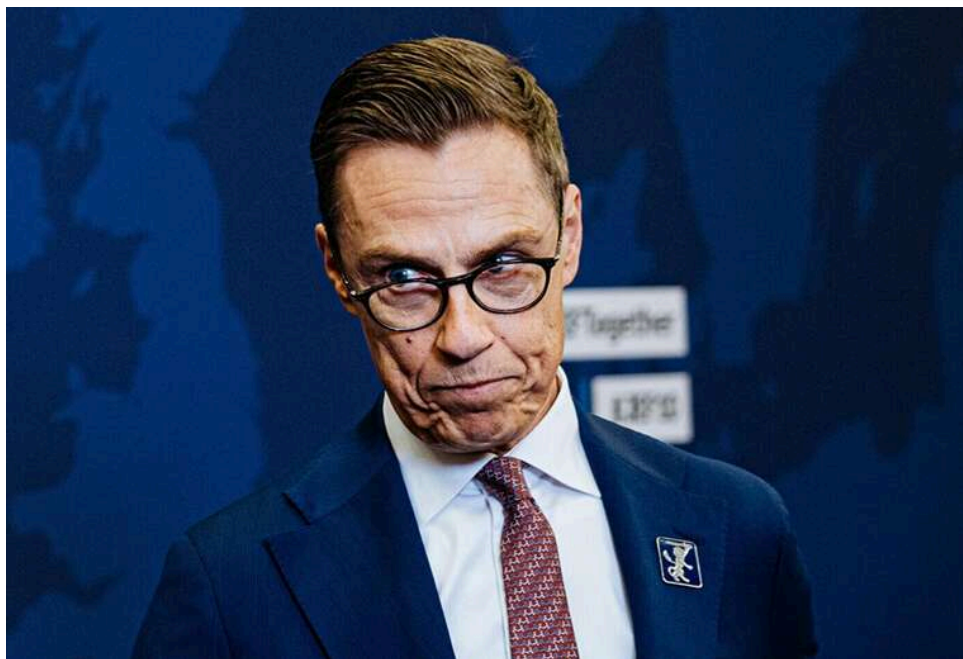
Економіка замість цінностей: Александр Стубб про нову парадигму зовнішньої політики США

Президент Фінляндії Александр Стубб заявив, що зовнішня політика США змінилася та стала більше зосередженою на економіці.