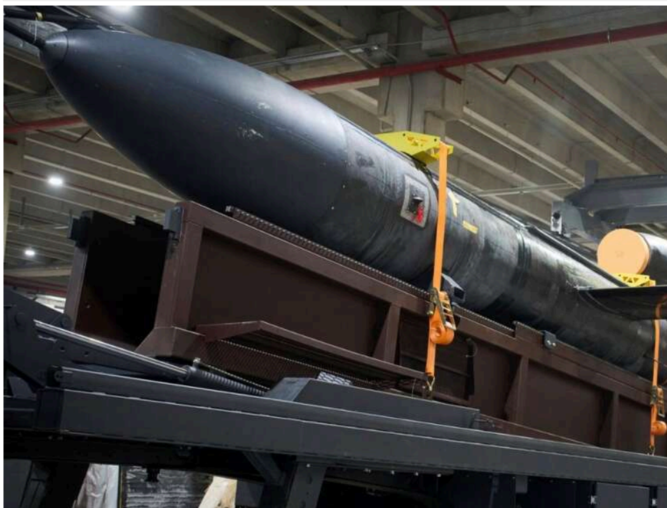
"Треба запускати якнайбільше": як виробники ракет Fire Point могли маніпулювати звітами для отримання бюджетних мільярдів

Народний депутат Гончаренко публікує фрагмент «плівок Міндіча», на яких, як стверджується, співвласник компанії Fire Point Хмельов говорить Цукерману, що підписання мирної угоди автоматично означатиме припинення держфінансування компанії.