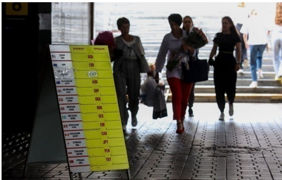
Обмінники купують долар у середньому по 43,75 гривні

Середній курс продажу долара впав до 43,85 гривні, а курс продажу євро знизився до 51,66 гривень.