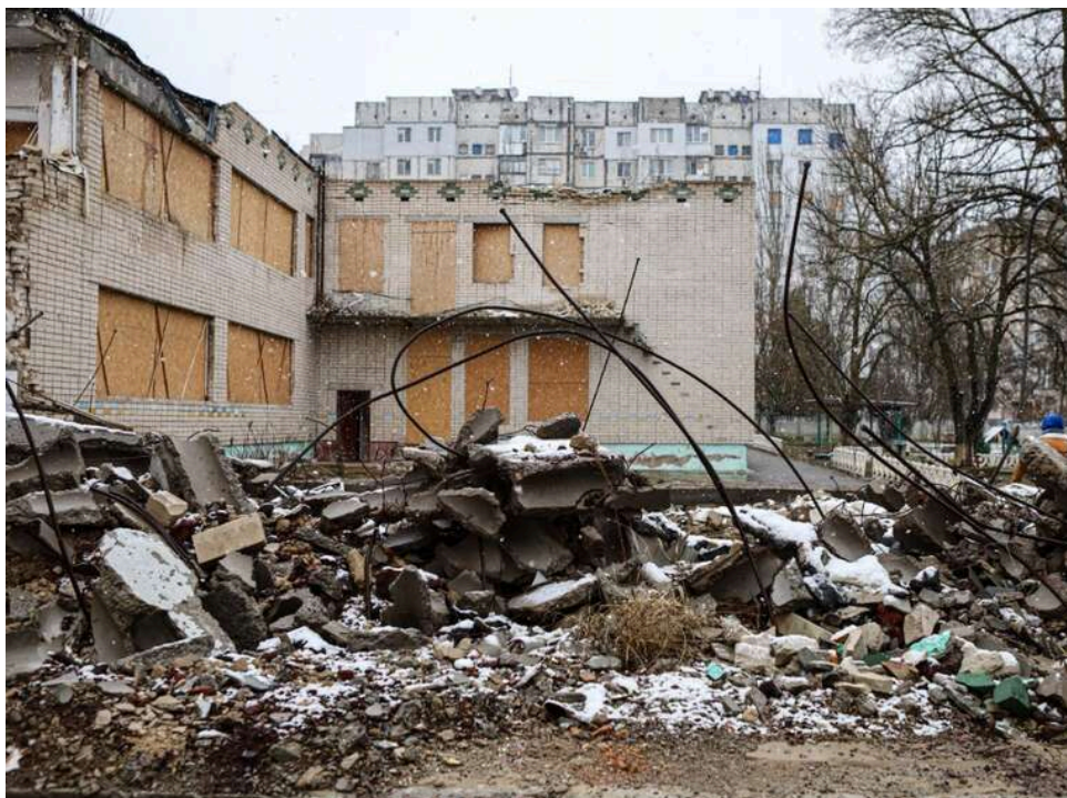
Пряме влучання КАБу: росіяни перетворили Херсонський політехнічний коледж на руїни

У мережі з'явилися кадри масштабних руйнувань будівлі Херсонського політехнічного коледжу, яка стала ціллю чергової атаки російських окупантів із застосуванням керованих авіабомб (КАБів).