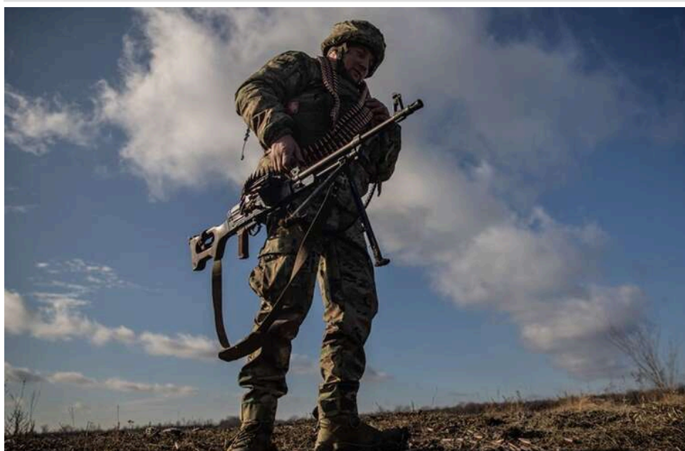
Втрати ворога: ЗСУ ліквідували ще 970 росіян і десятки одиниць техніки

Протягом доби 4 травня українські захисники ліквідували та поранили ще 970 російських окупантів. Крім того, на полі бою було знищено десятки одиниць різної ворожої техніки.