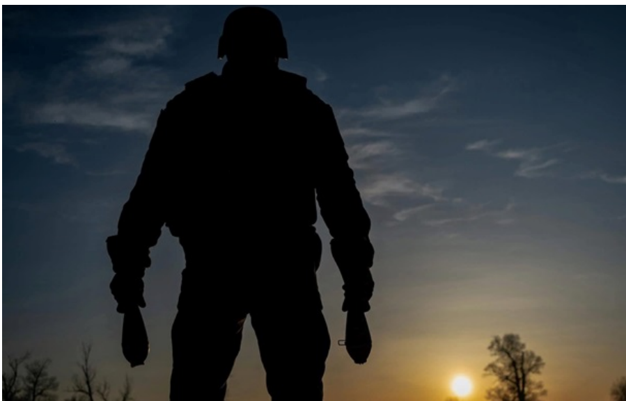
Українські оборонці за минулу добу знищили ще 970 російських загарбників

Загальні втрати росіян від початку повномасштабного вторгнення сягнули близько 1 336 120 осіб.