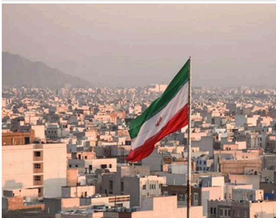
Ультиматум Тегерана: Іран передав США через Пакистан перелік безкомпромісних вимог

Іран через пакистанських посередників передав перелік своїх «червоних ліній» для перемовин із США.