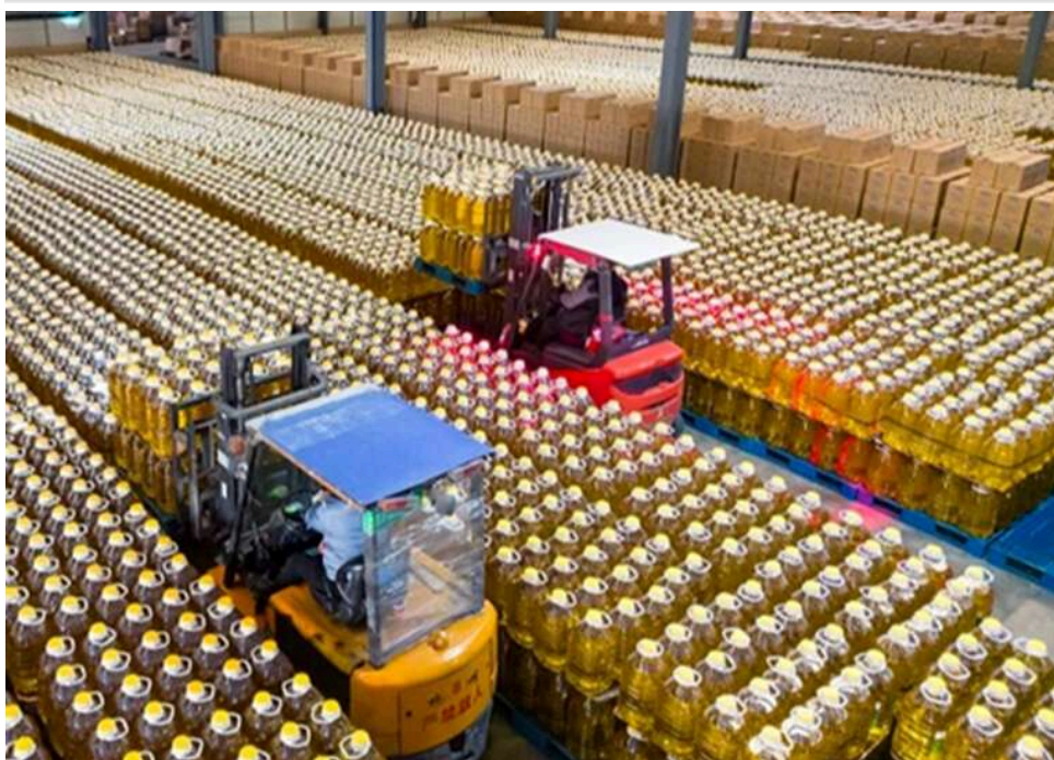
На Кіровоградщині директора фірми оштрафували на 783 тисячі за експорт олії фейковій компанії

Експорт соняшникової олії через «фірму-привид»: директора компанії оштрафували на 783 тисячі гривень.