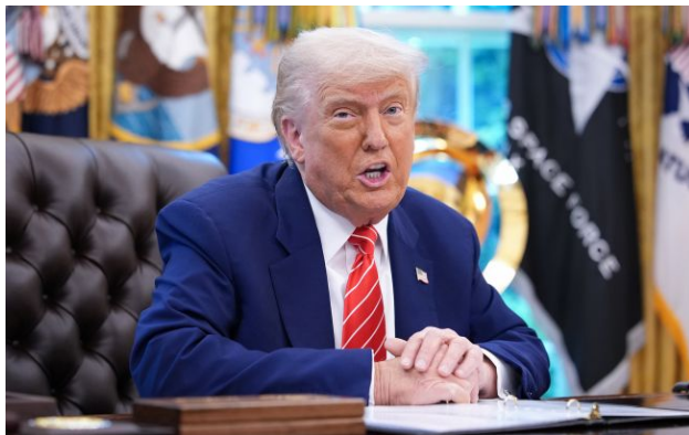
Фото: Дональд Трамп (Getty Images)

Обирайте перевірене - додайте РБК-Україна до улюблених джерел у Google