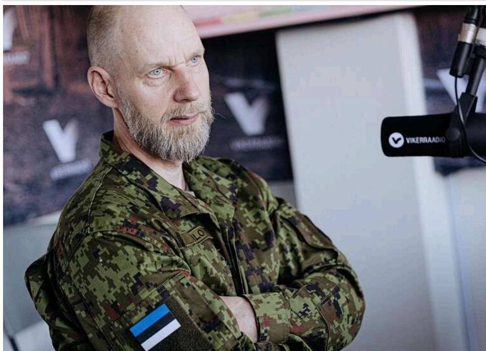
Командувач Сил оборони Естонії попередив про можливу нову агресію РФ після війни в Україні

Командувач Сил оборони Естонії Андрус Мерило заявив про ризик нової агресії з боку Росії після завершення війни проти України.