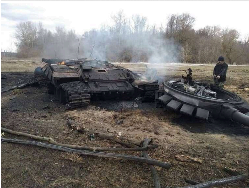
Втрати ворога за добу: ЗСУ знешкодили 1130 окупантів і п'ять бойових броньованих машин

Захисники України за попередню добу зменшили чисельність російських окупантів на 1130 загарбників. Загалом бойові втрати особового складу РФ сягають 1 млн 308 тис. 670 осіб.