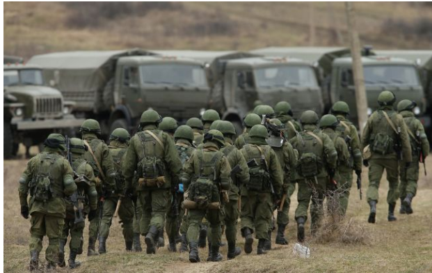
Фото: російські військові (Getty Images)

Обирайте перевірене - додайте РБК-Україна до улюблених джерел у Google