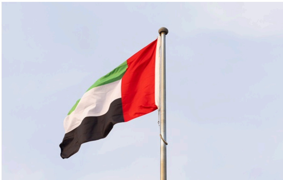
В ОАЕ підтвердили атаку з боку Ірану

Міністерство оборони підтвердило, що звуки, які чули в різних частинах країни, є результатом успішного перехоплення повітряних загроз.