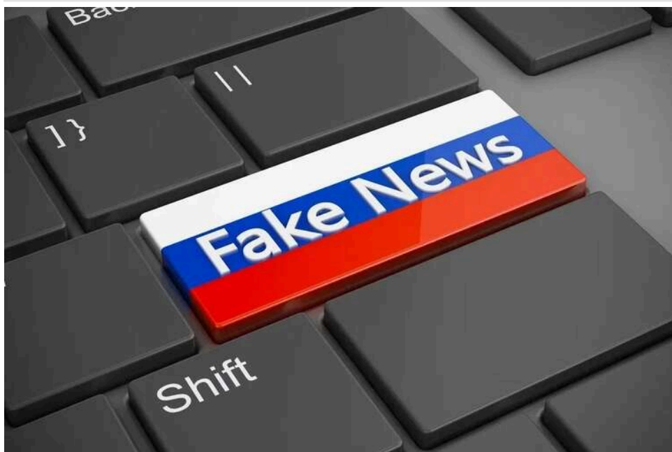
Фейк про "військові поїзди": як російська пропаганда вигадує виправдання для обстрілів залізниці

Російська Федерація розповсюджує фальшивку про те, що Збройні Сили України нібито застосовують цивільні потяги для армійських цілей. Це робиться з метою виправдати постійні обстріли з боку росіян.