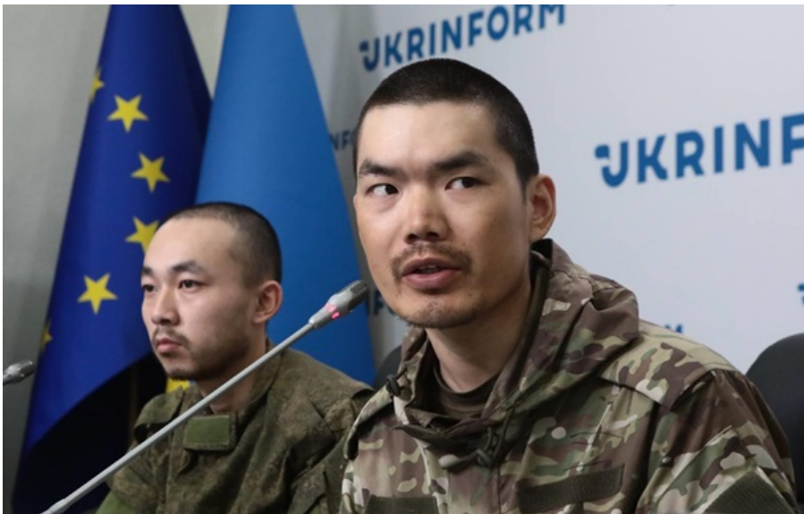
Двоє китайців і досі пробувають у СІЗО Служби безпеки України