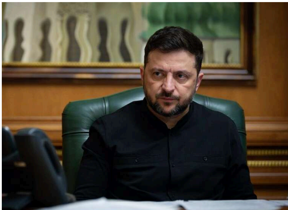
Пів року до банкрутства: Зеленський назвав терміни економічного краху РФ за умови повних нафтових санкцій

Росія може стати банкрутом – повернення жорстких санкцій проти російської нафти в повному обсязі може призвести до фінансового краху країни-агресорки в стислі терміни.