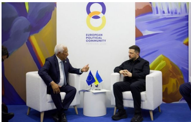
Фото: Володимир Зеленський та Антоніу Кошта

Обирайте перевірене - додайте РБК-Україна до улюблених джерел у Google