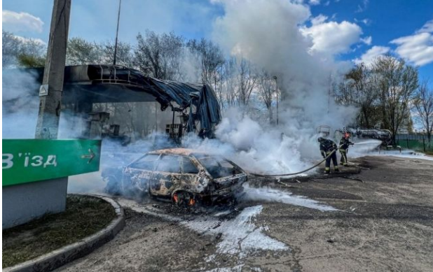
Фото: удар по АЗС у Харкові

Обирайте перевірене - додайте РБК-Україна до улюблених джерел у Google