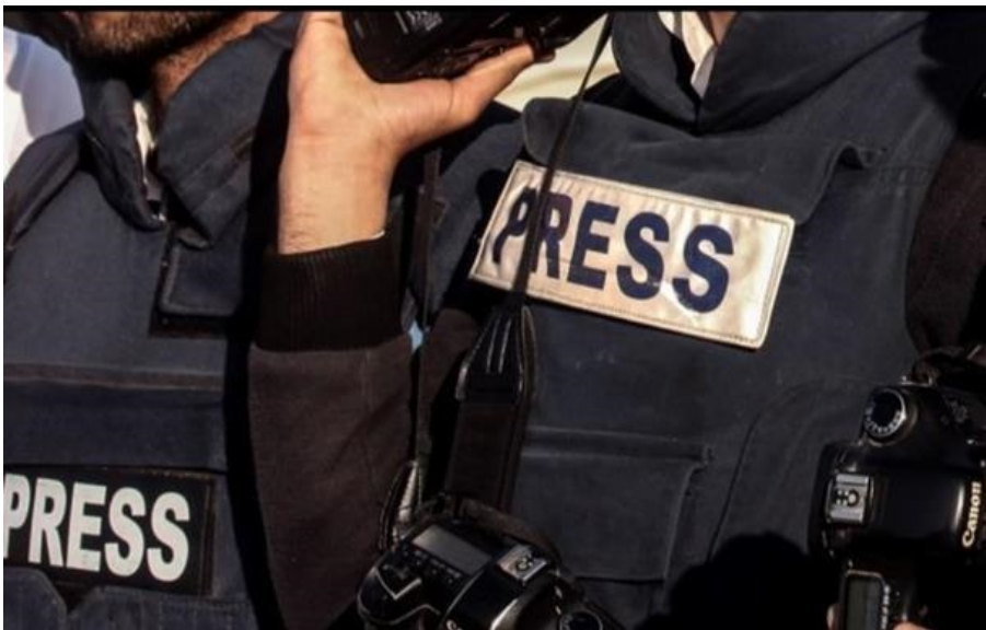
Фото: Соцмережі (ілюстративне фото) Росія тримає в полоні 30 українських журналістів

З початку повномасштабного вторгнення Росія вбила щонайменше 149 медійників, серед яких як українські, так і іноземні журналісти.