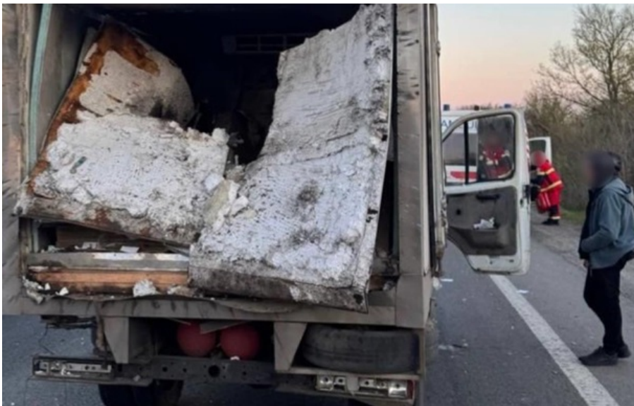
Пошкоджено хлібний фургон

Водій дістав закриту черепно-мозкову травму та струс головного мозку, експедитор отримав гостру реакцію на стрес.