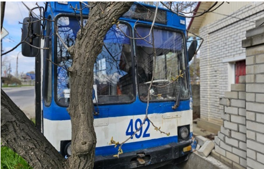
Росіяни щодня атакують громадський транспорт у Херсоні

У зв'язку з погіршенням безпекової ситуації тролейбуси не ходитимуть орієнтовно тиждень - з 4 до 10 травня.