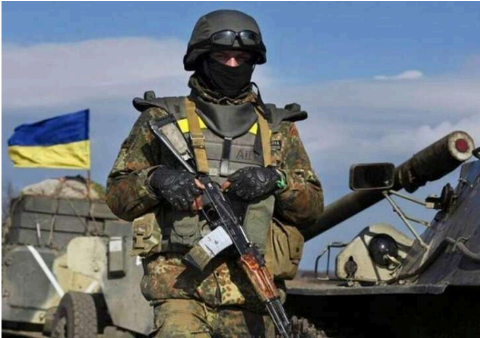
Ситуація на фронті: ЗСУ відбили десятки атак під Покровськом та Костянтинівкою, ворог зазнає значних втрат

Станом на 22.00 3 травня сталося 122 бойові зіткнення.