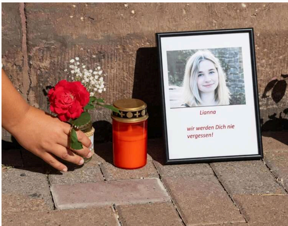
У Німеччині суд визнав неосудним чоловіка, який штовхнув українську дівчину під потяг