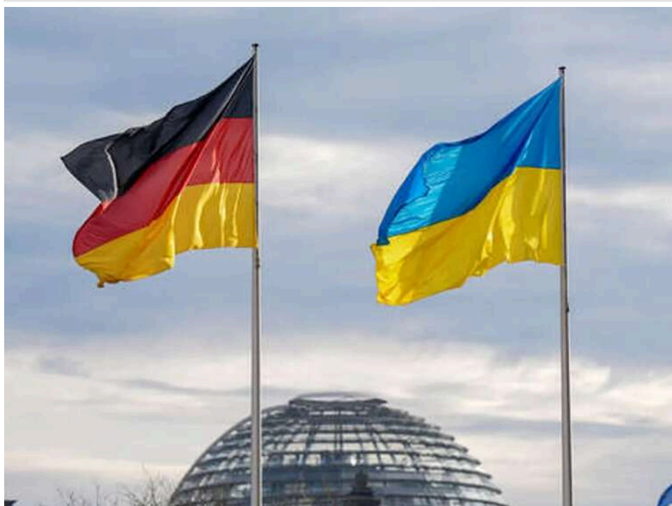
«Німеччина гнеться перед Києвом»: головред NZZ Ерік Гуєр різко розкритикував «ідеалізацію» України в Берліні

Впливова німецькомовна газета Neue Zürcher Zeitung розмістила на першій смузі статтю головного редактора Еріка Гуєра, де різко критикується українська влада та позиція Німеччини щодо неї.