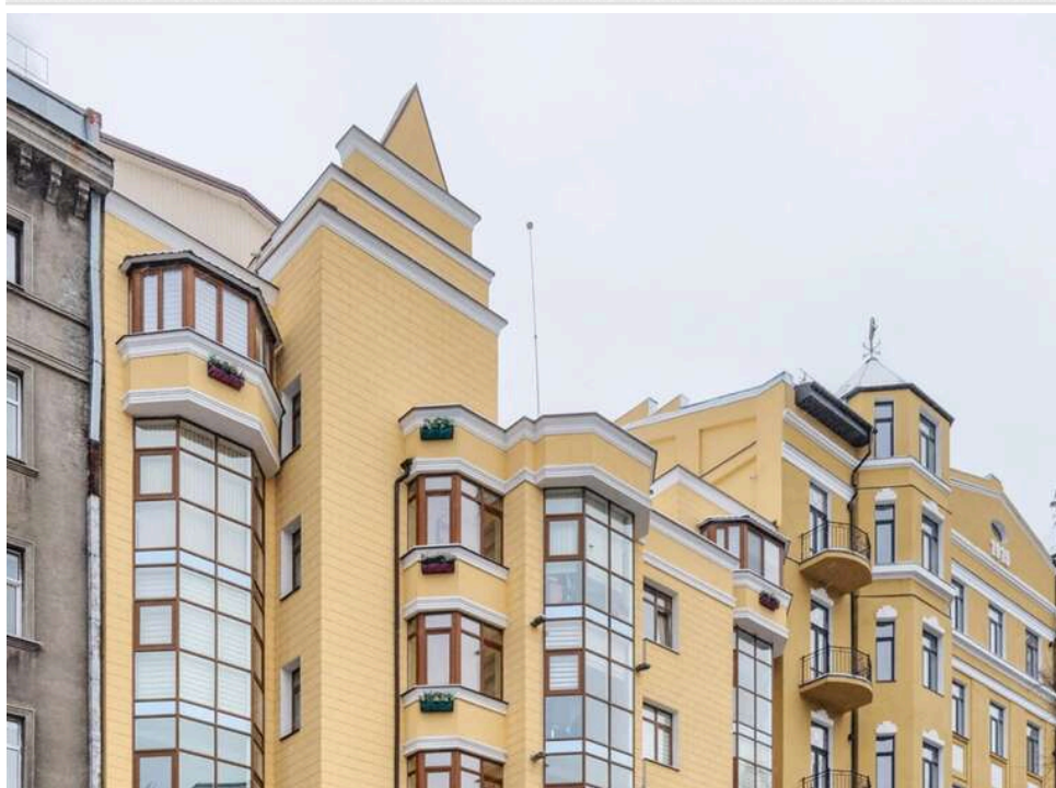
Рейдерство на 5 мільярдів: у родини судді через «чорних реєстраторів» відібрали бізнес-центр у центрі Києва

Будівля по вулиці Івана Франка, 15-а в Києві арештована в кримінальному провадженні про шахрайське заволодіння майном.