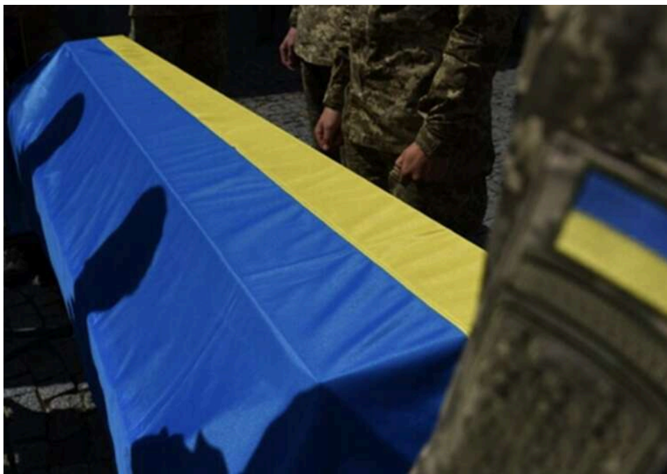
«Він не був воїном, він був душею громади»: На фронті загинув військовий із Мукачева

На фронті загинув житель Мукачева, стан здоров'я якого проігнорували під час мобілізації.