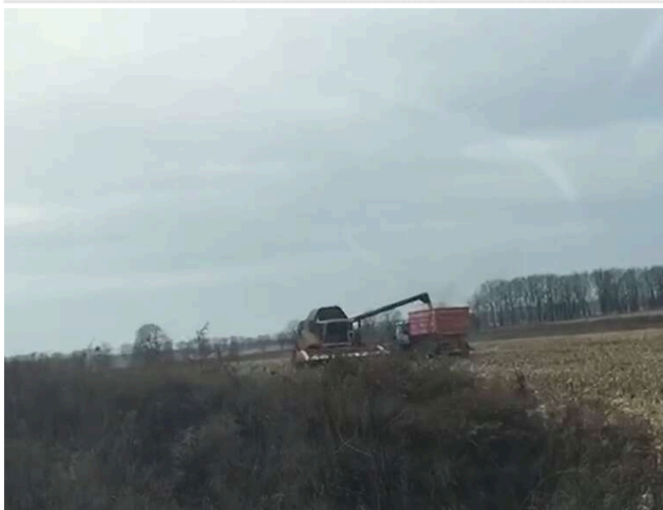
Примарна влада та реальний врожай: у Чорнобильській зоні роками незаконно сіяли пшеницю за рішенням неіснуючої ради

Прокуратура повідомляє, що у Чорнобильській зоні відчуження з 2020 року незаконно вирощують пшеницю та кукурудзу, посиляючись на рішення неіснуючої районної ради.