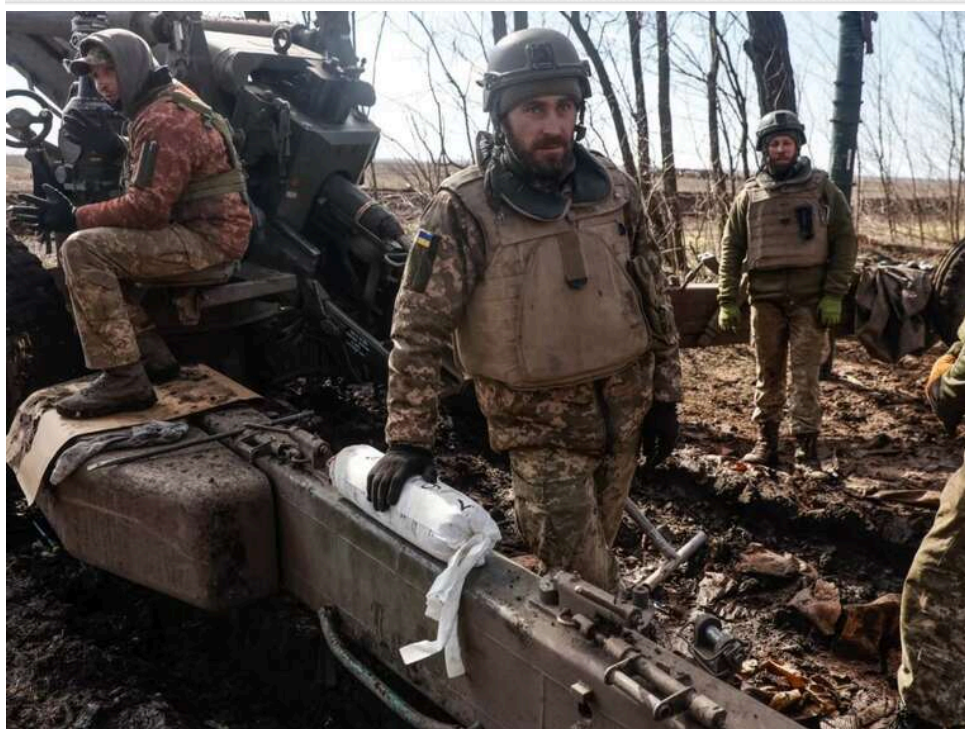
Ситуація на фронті: Зафіксовано 141 бойове зіткнення, найбільше ворожих штурмів на Покровському, Гуляйпільському та Костянтинівському напрямках

Загалом упродовж минулої доби, 2 травня 2026 року, на фронті зафіксовано 141 бойове зіткнення.