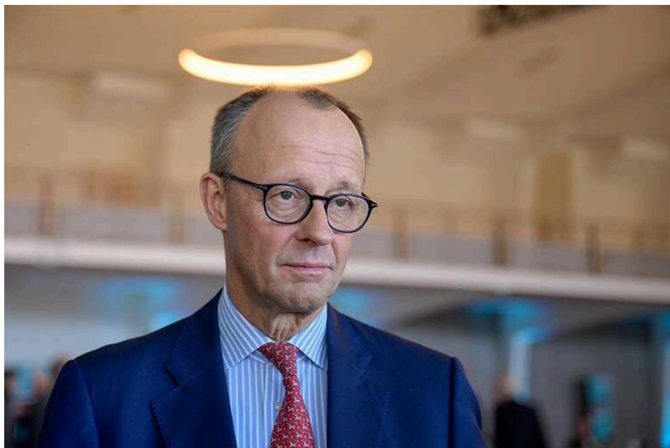
Суд зобов'язав розкрити дані: у Німеччині розслідують сотні справ про образи канцлера Мерца

У Німеччині перевіряють сотні справ про образи Мерца – власті змушені оприлюднити дані.