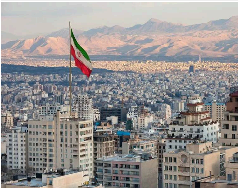
14 пунктів Тегерана: Іран висунув США радикальні умови для повного припинення конфлікту

Іран надіслав США план із 14 пунктів для врегулювання конфлікту. Про це повідомляє іранське агентство Tasnim.