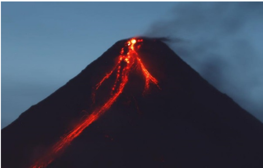
Виверження на вулкані Майон

Наразі події присвоєно третій рівень загрози, що означає помірне та сильне виверження вулкана.