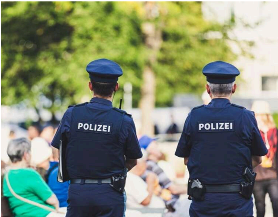
Вбивство 16-річної українки у Фрідланді: німецький суд визнав обвинуваченого неосудним і призначив лікування

У Німеччині суд виніс рішення у справі про загибель 16-річної українки, яку 2025 року штовхнули під товарний потяг у Фрідланді. Обвинуваченого, 31-річного громадянина Іраку, визнали неосудним і направили на примусове психіатричне лікування.