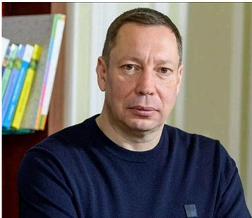
Розкрадання 206 мільйонів: ВАКС розпочинає розгляд справи щодо ексголови Нацбанку Кирила Шевченка