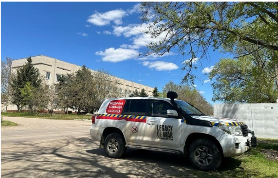
Фото: Херсонська ОВА (ілюстративне фото) Потерпілих у стані середньої тяжкості помістили в лікарню

Ворожий удар призвів до поранень чотирьох людей - жінки 57 та 52 років й чоловіки 54 та 51 року.