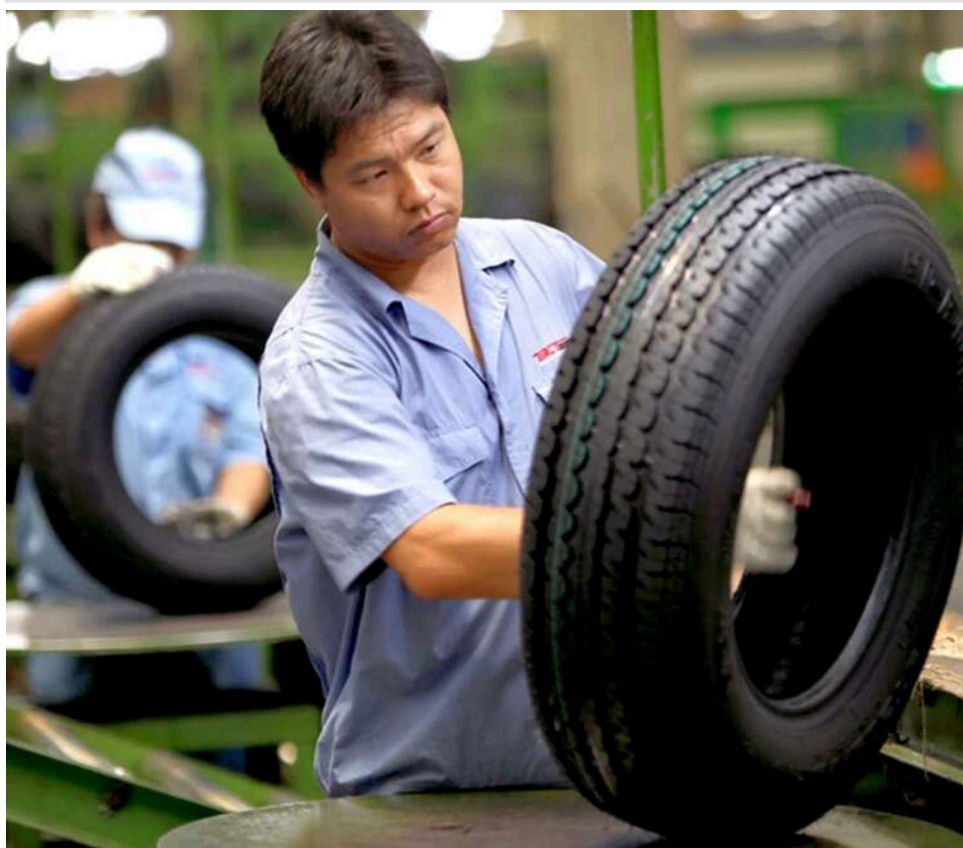
Шинний ринок РФ йде на дно: власне виробництво впало на 21% через експансію Китаю

Китайські автомобільні шини так бурхливо заповнили ринок Росії, що вітчизняні виробники вимагають державного захисту. За останній рік кількість китайських брендів у продажу зростає з 200 до 250 і продовжує збільшуватися.